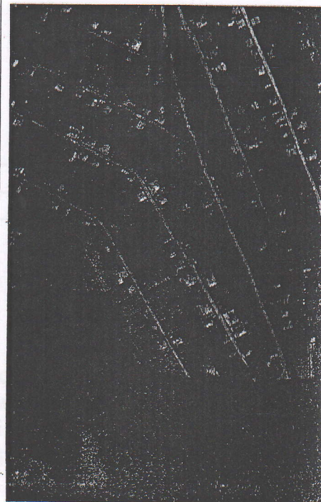
223 - numărul cadastral al terenului 01 - numărul cadastral al clădirii