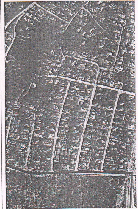
124 - numărul cadastral al terenului 01 - numărul cadastral al clădirii