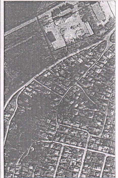
248 - numărul cadastral al terenului 01 - numărul cadastral al clădirii