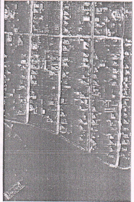
404 - numărul cadastral al terenului 01 - numărul cadastral al clădirii