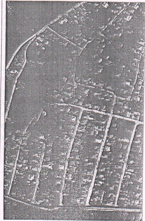
150 - numărul cadastral al terenului 01 - numărul cadastral al clădirii