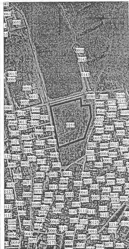
0259 - numărul terenului