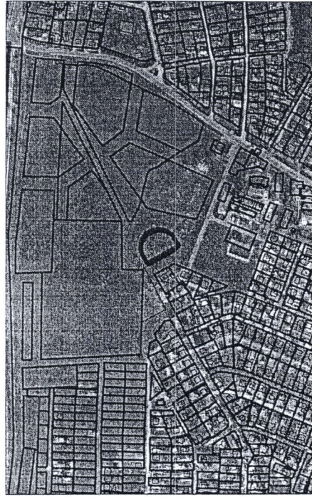
639 - numarul cadastral al terenului 01 - numarul cadastral al cladirii