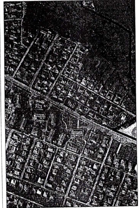
238 - numărul cadastral al terenului 01 - numărul cadastral al clădirii