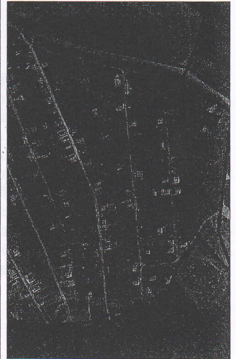
476 - numarul cadastral al terenului 01 - numarul cadastral al cladirii