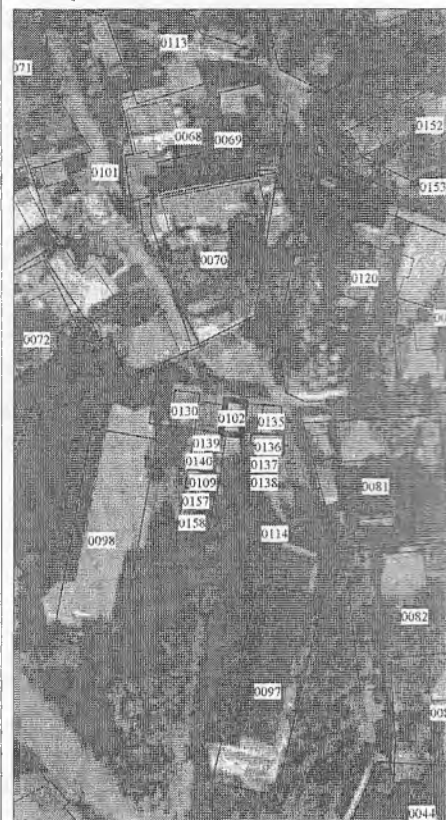
0102 - numărul terenului