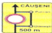
1.1 Schema provizorie de ocolire