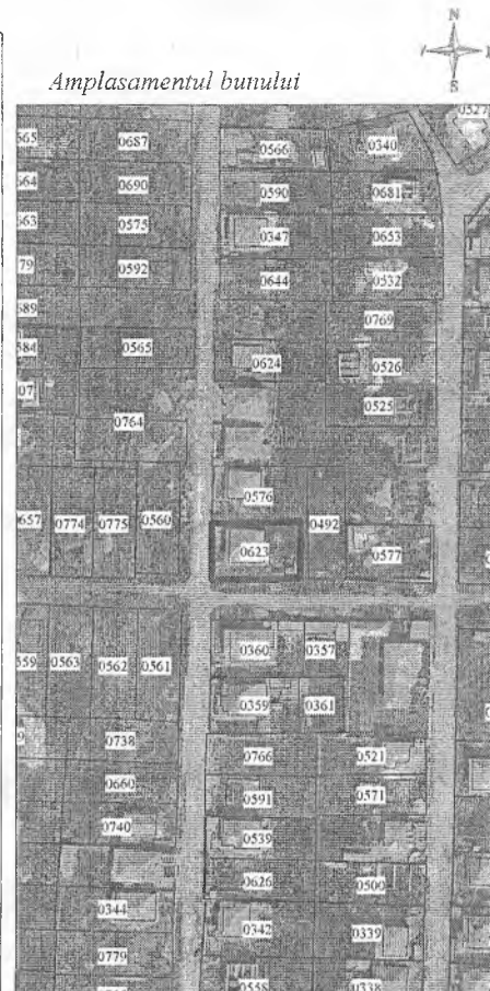
0623 - numărul terenului