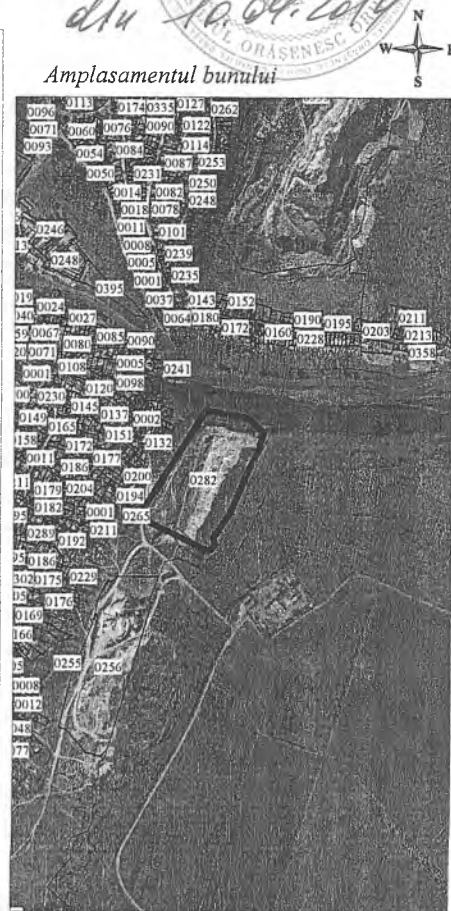
0282 - numărul terenului