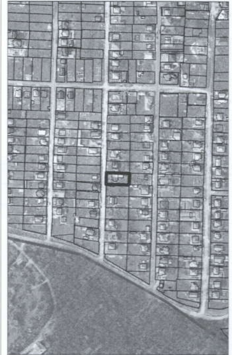
[redacted] numărul cadastral al terenului 01 - numărul cadastral al clădirii