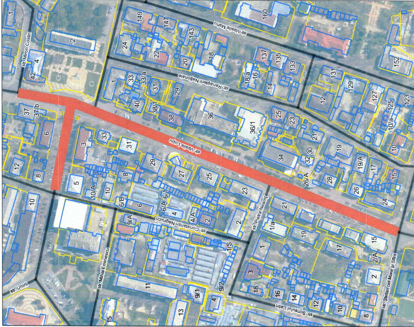
Plan detaliu sc. 1:2.750