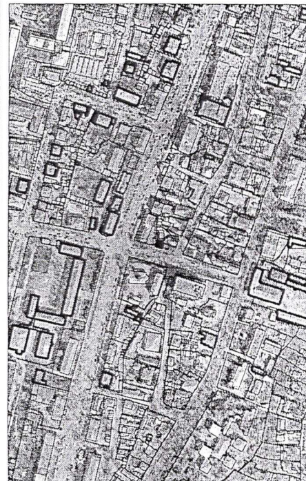
388 - numarul cadastral al terenului 01 - numarul cadastral al cladirii