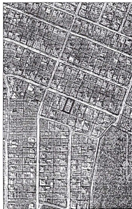
218 - numărul cadastral al terenului 01 - numărul cadastral al clădirii