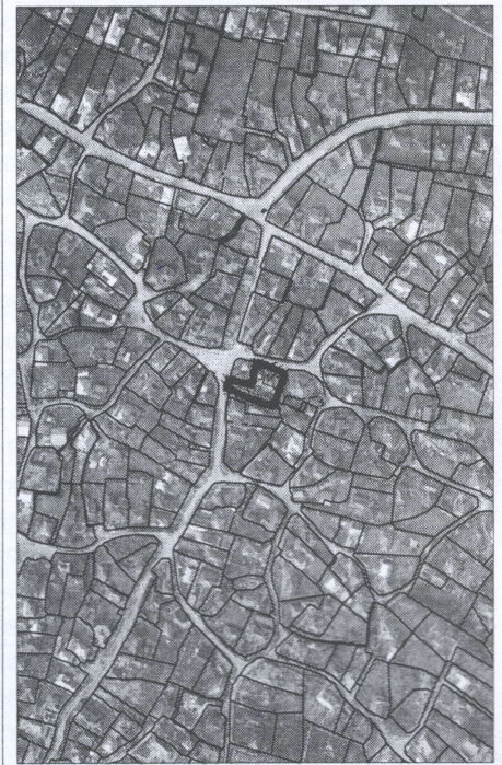
161 - numărul cadastral al terenului 01 - numărul cadastral al clădirii