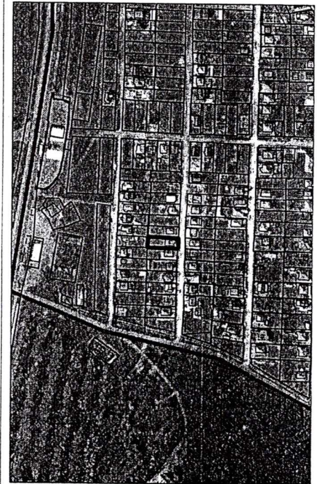
735 - numărul cadastral al terenului 01 - numărul cadastral al clădirii