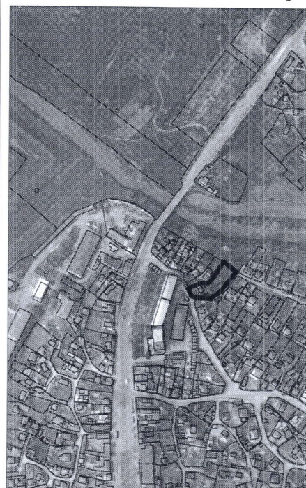
015 - numărul cadastral al terenului 01 - numărul cadastral al clădirii