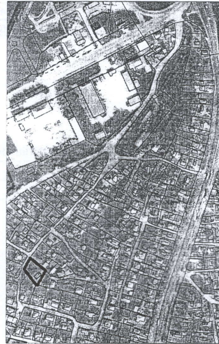
267 - numărul cadastral al terenului 01 - numărul cadastral al clădirii